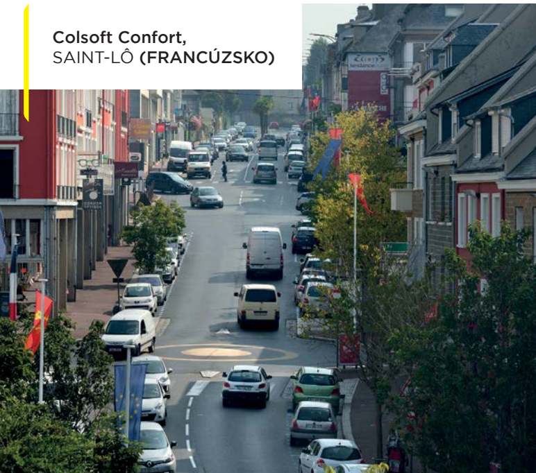
Colsoft Confort, SAINT-LÔ (FRANCÚZSKO)