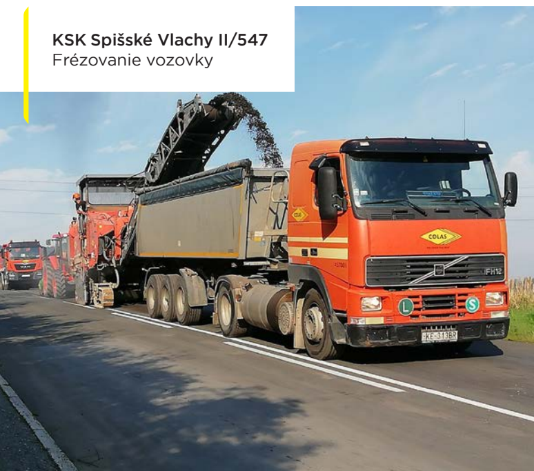
KSK Spišské Vlachy II/547 Frézovanie vozovky