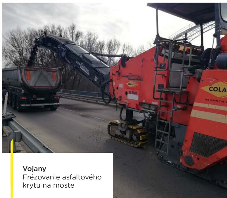
Vojany Frézovanie asfaltového krytu na moste