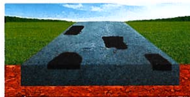
Vyplnenie – oprava výtlkov