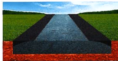
Reprofilácia grejderom alebo finišerom

Studená asfaltová zmes TatraCol je vyrábaná procesom obalovania so špeciálne navrhnutým spojivom. Vďaka tomu má nižšiu medzerovitosť a je súdržnejšia ako bežné asfaltové zmesi. Ponúka vyššiu mechanickú odolnosť a nižšiu citlivosť na vodu.